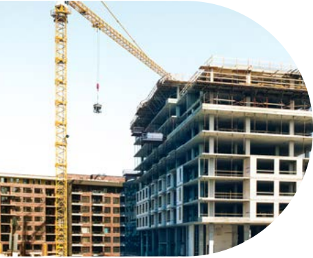
Description et objectif du programme